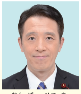
南波 秀樹 公明党