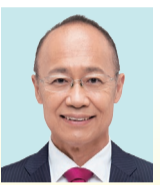
西家 克己 公明党