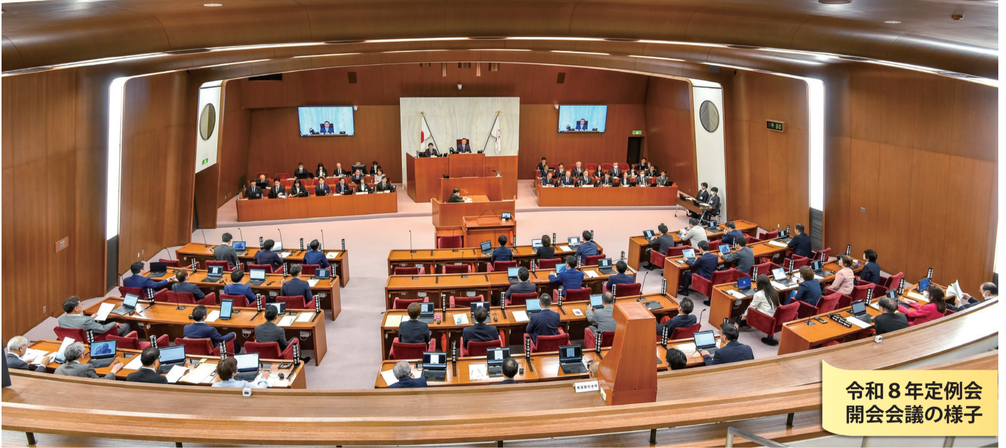
令和8年定例会 開会会議の様子