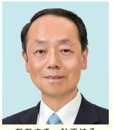
大崎 秀治 公明党