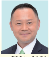
岡本 浩三 公明党