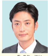
務川 慧 自民党