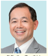
大八木 聡 自民党