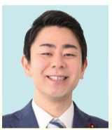
鈴木 晃地 日本維新の会