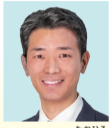
こさわ 隆宏 日本維新の会