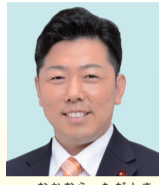
中村 忠辰 公明党