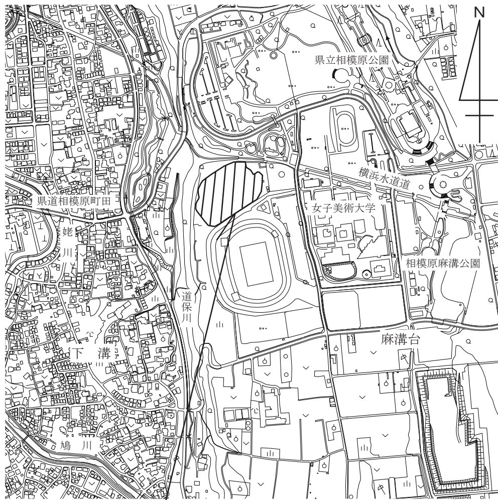
相模原麻溝公園第2競技場