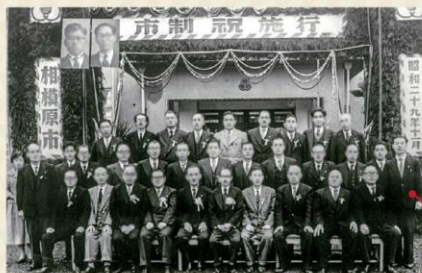
昭和29年 市議会議員の集合写真 (市制施行祝賀アーチ前にて撮影)

当時は、シャープ勧告により地方財政の強化が求められ、固定資産税が創設された頃で、多くの職員が採用され、主に税務関係の部署や出先機関に配属されました。採用後の研修で、地方自治法や地方公務員法、地方税法などを勉強して、その後の作文試験の結果が良かったからか、昭和27年に議会の事務局職員(書記)となりました。