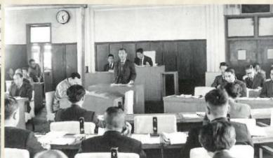
旧庁舎議場での本会議(昭和37年)

専用の議場は、昭和29年4月に、新しい町役場庁舎の2階に初めて設けられました。 現在の議場は、市役所本庁舎が完成した昭和44年から使用しています。