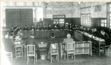
上溝小学校講堂での町議会(昭和26年)

議会を開催するときは、町役場の近くにあった小学校の講堂や警察署の会議室を借りて、会議用の机やイスをトラックで運び、議場を設営していました。