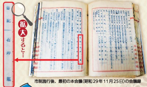
市制施行後、最初の本会議(昭和29年11月25日)の会議録

県内ではすでに速記者により対応していた議会があり、後に相模原町でも衆議院の速記者養成所を卒業した人が採用されました。