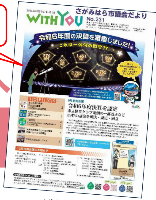
しがき 市議会だよりイメージ